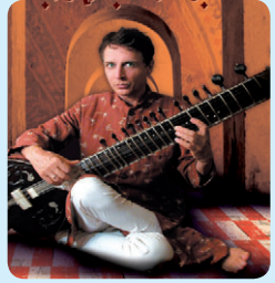
Al Gromer Khan